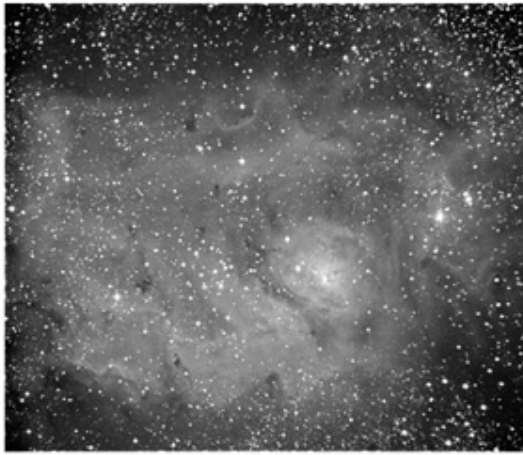
HyperStar 14 w/ST-10XME 30 second exposure

The image below compares a single, unguided 30-second HyperStar C14 exposure to a 70-minute film photograph taken with one of the world's premier astrographic refractors, the Astro-Physics 155EDF. Note that not only are more stars and more nebular details visible in the HyperStar shot, but the stars are much smaller as well. The high optical quality of the HyperStar lens combined with short exposures to minimize seeing effects results in tiny star images. And it was done 140 times faster!