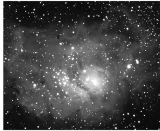
Astro-Physics 155EDF w/Film 70 minute exposure